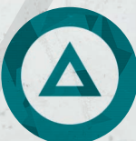
Ficha de Runas de guía