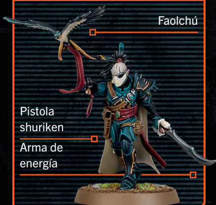
Pistola shuriken Arma de energía