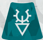
Ficha de Escudo protector