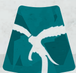
Ficha de Vínculo del Faolchú