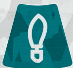
Ficha de Un paso por delante