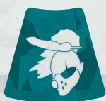
Ficha de Cazador erudito