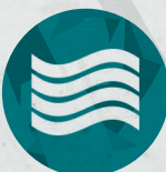
Ficha de Campo brumoso