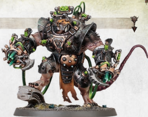
Sturmbestie mit Schockfäusten

Effekt: Jene Einheit kann die Fähigkeit „Normale Bewegung“ wie in deiner Bewegungsphase einsetzen.